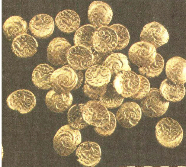
Munten uit de 'Schat van Amby'.

In de media duiken regelmatig artikelen op over de te Amby bij Maastricht gevonden muntschat. Deze muntschat wordt toegeschreven aan de Eburonen, aangezien de traditie dit gebied ooit aanwees als woonplaats van de Eburonen. Volgens prof. Nico Roymans is de schat waarschijnlijk in het midden van de 1 e eeuw v.Chr. in onbewoond gebied verborgen 1 . De vondst is uniek voor ons land en blijkt de eerste en tot nog toe de enige in Nederland te zijn. De munten worden tevens Keltisch genoemd, aangezien de Eburonen als een Keltische stam wordt beschouwd.